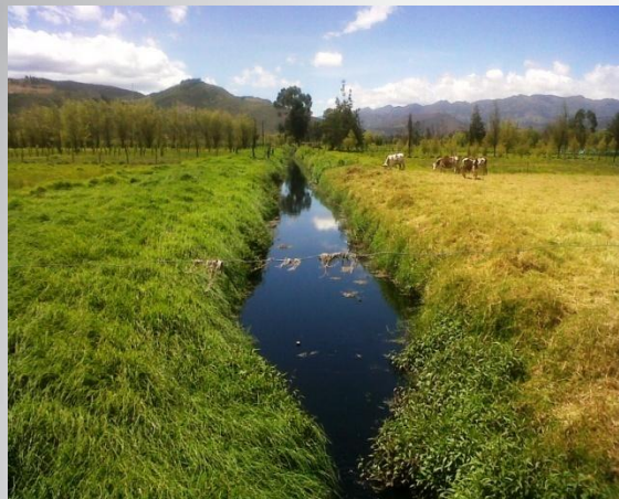
FOTO ANTES DE INTERVENCIÓN JUNTO A LA VIA VALLADO CAIMAN.