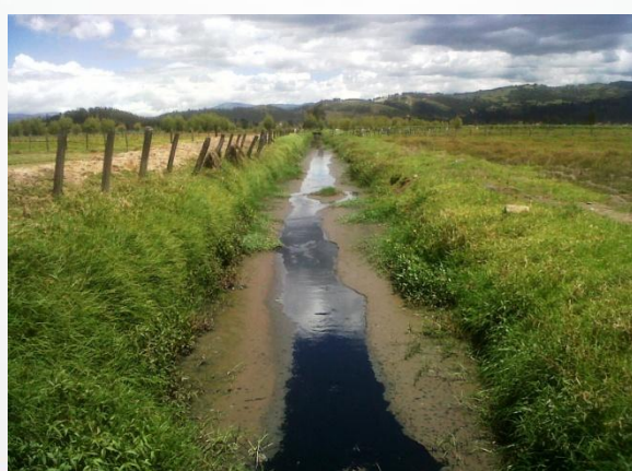
FOTO ANTES DE INTERVENCION VISTA HACIA EL SUR, DESDE PTE BARRIO LAS ACIAS