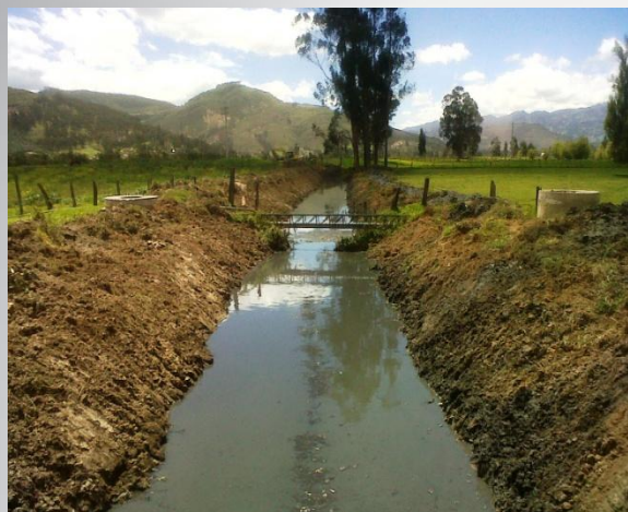
FOTO FINAL TRAMO HACIA COMPUERTAS NORTE.