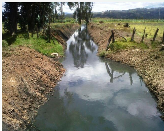
FOTO FINAL TRAMO PUENTE JUANITO HACIA EL SUR.