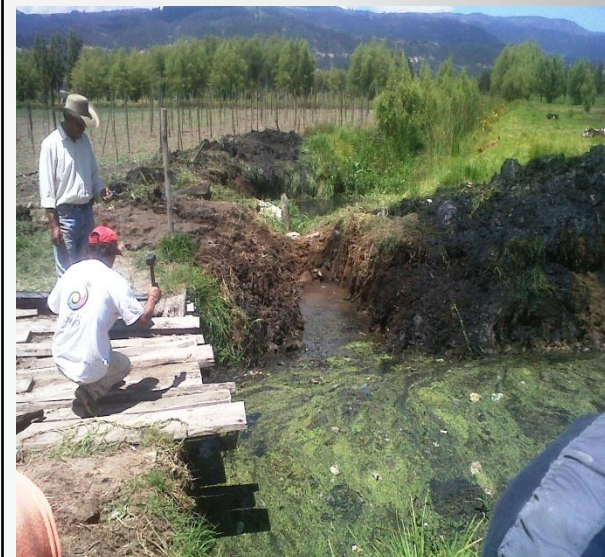
TRABAJOS EN LIMPIEZA DE UN PUNTE PEATONAL CON LA COMUNIDAD

Trabajos de dragado y ampliación del canal del caimán terminados el día 27 de Junio de 2013.