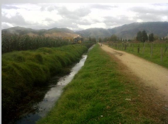
FOTO ANTES DE INTERVENCIÓN VISTO DESDE PTE HACIA ESCUELA SIATAME