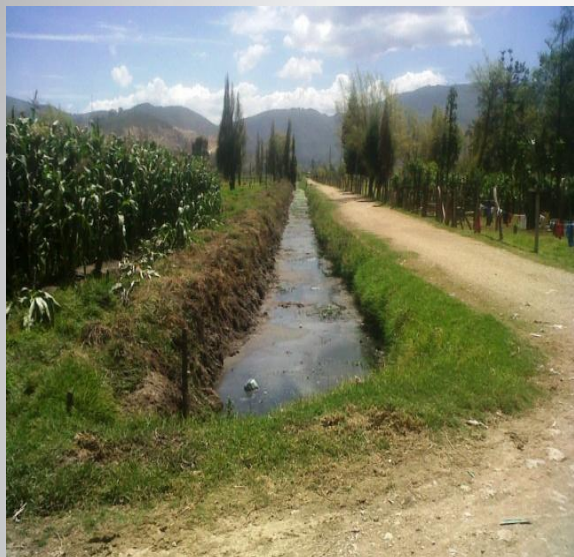
VISTA FINAL TRAMO PARALELO A LA VIA