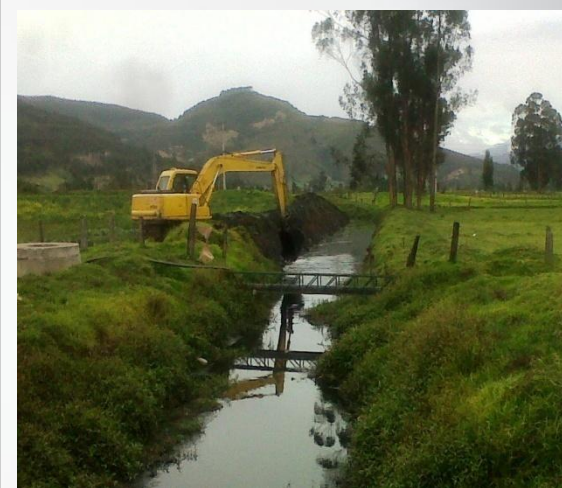
FOTO INICIO DIA 14 DE JUNIO 2013, VISTA HACIA COMPUERTAS NORTE.

Con el fin de reducir el riesgo por inundación en la vereda Siatame, se gestiona desde el Municipio de Sogamoso y la coordinación de Gestión del Riesgo de Desastres, 150 horas de dragado del canal el caimán, beneficiando a más de 250 familias de los sectores cercanos. Además de evitar pérdidas cercanas por más de $200 millones de pesos en cultivos de hortalizas. Este Apoyo desde la UNGRD y la Gobernación de Boyacá es por aproximadamente $27.000.000, haciendo de Sogamoso más competitiva y Segura ante Desastres.