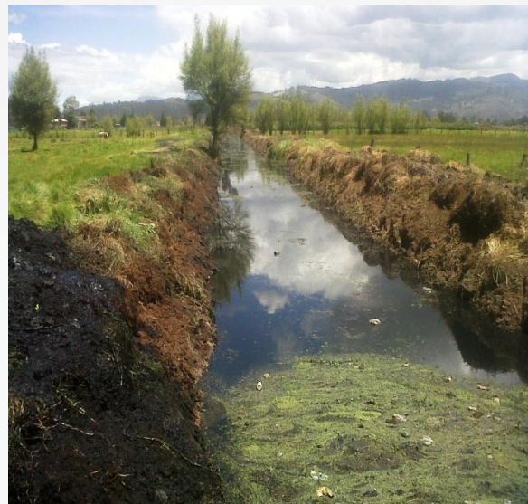
FOTO FINAL INTERVENCIÓN VISTA HACIA EL SUR