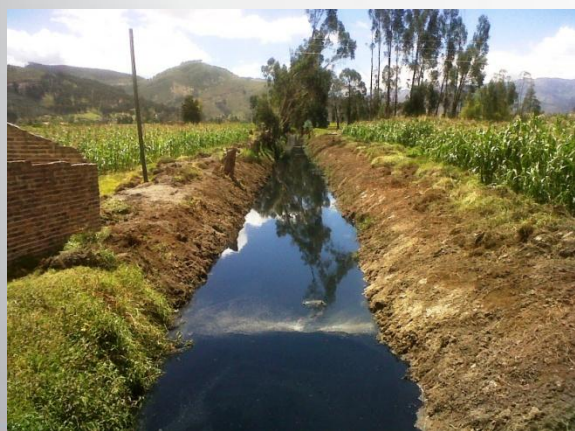
FOTO FINAL VISTO DESDE PTE VIA BARRIO LAS ACIAS