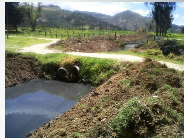
FOTO FINAL TRAMO PUENTE JUANITO DESPEJE DE TUBERIAS