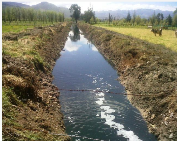
FOTO LUEGO DE INTERVENCIÓN JUNTO A LA VIA VALLADO CAIMAN