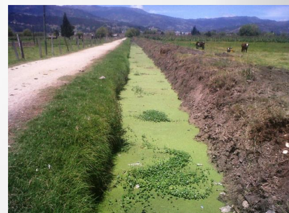
FOTO FINAL DE INTERVENCIÓN PUENTE JUANITO DESPEJE DE TUBERIAS.