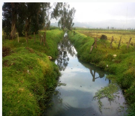
FOTO ANTES DIA 12 DE JUNIO 2013, VISTA HACIA EL SUR