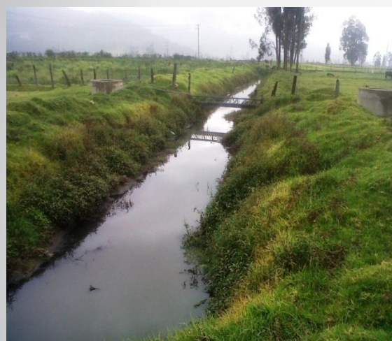
FOTO ANTES DIA 12 DE JUNIO 2013, VISTA HACIA COMPUERTAS NORTE.

INFORME ACCIONES DE APOYO CON LA UNIDAD NACIONAL DE GESTION DEL RIESGO DE DESASTRES EN EL CANAL EL CAIMÁN (150 HORAS DE RETROESCAVADORA)