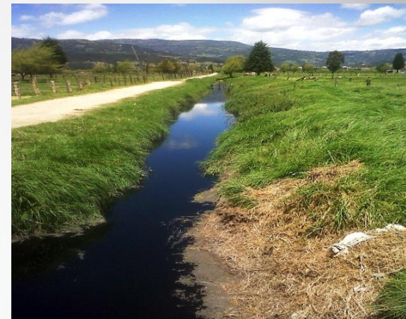
FOTO FINAL TRAMO PUENTE JUANITO DESPEJE DE TUBERIAS