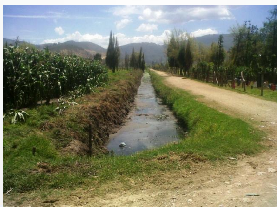
FOTO LUEGO DE INTERVENCIÓN VISTO DESDE PTE HACIA ESCUELA SIATAME